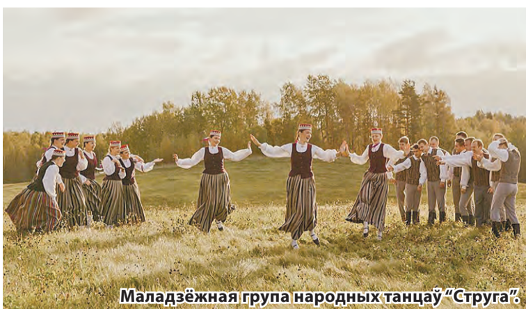
Маладзёжная група народных танцаў «Струга».

Сёлетні год для калектыву юбілейны, ён адзначае сваё дзесяцігоддзе. За гэты час ансамбль быў удзельнікам шмат-