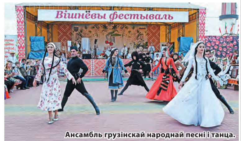
Ансамбль грузінскай народнай песні і танца.

Фіналістка нацыянальных адборачных тураў «Славянскі базар у Віцебску», «Еўрабачанне», «Новая хваля»; фіналістка тэлепраекта «Я спяваю»; лаўрэат міжнародных конкурсаў, таленавітая артыстка, чые карані ідуць з