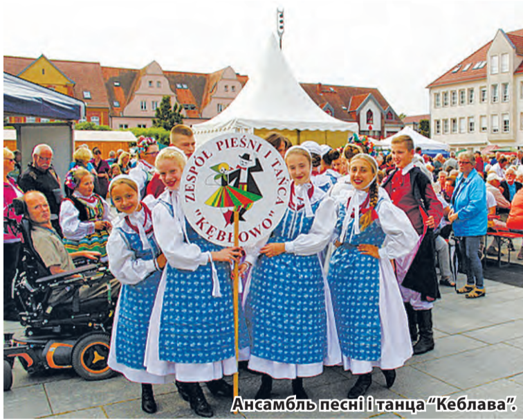
Ансамбль песні і танца «Кеблава».

ЯРКІ, САМАБЫТНЫ, АДМЕТНЫ, КАЛЯРОВЫ, СПЕЎНЫ! ТАКІМ НАШ «ВИШНЁВЫ ФЕСТИВАЛЬ» МЫ БАЧЫМ ШТОГОД, ДЗЯКУЮЧЫ ІМ, ТАЛЕНАВІТІМ АРТЫСТАМ, ЯКІЯ ПРЫЯЗДЖАЮЦЬ ЗДАЛЁК ДА НАС, У ФЕСТИВАЛЬНАЕ ГЛЫБОКАЕ. ДЗЯКУЮЧЫ ГЭТЫМ КАЛЕКТЫВАМ, ЖЫХАРЫ І ГОСЦІ ВИШНЁВАЙ СТАЛІЦЫ ЗНАЁМЯЦЦА З ТВОРЧАСЦЮ САМЫХ РОЗНЫХ КРАІН, А «ВИШНЁВЫ ФЕСТИВАЛЬ» КВІТНЕЕ АД ІХ ЯРКІХ НАЦЫЯНАЛЬНЫХ КАСЦЮМАЎ, ВІРУЕ АД ІХ ЗАХАПЛЯЛЬНЫХ ТАНЦАЎ, СПЯВАЕ АД ІХ МЕЛАДЫЧНЫХ ПЕСЕНІ І МУЗЫЧНЫХ КАМПАЗІЦЫЙ. МЫ РАДЫ ВІТАЦЬ ВАС, УДЗЕЛЬНІКІ VII МІЖНАРОДНАГА СВЯТА «ВИШНЁВЫ ФЕСТИВАЛЬ»! ДАВАЙЦЕ З ВАМІ ЗНАЁМІЦЦА!