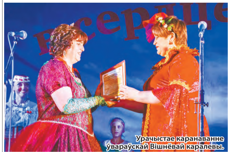
Урачыстае каранаванне ўвараўскай Вішнёвай каралевы.

• Галіна СУТУЛА.