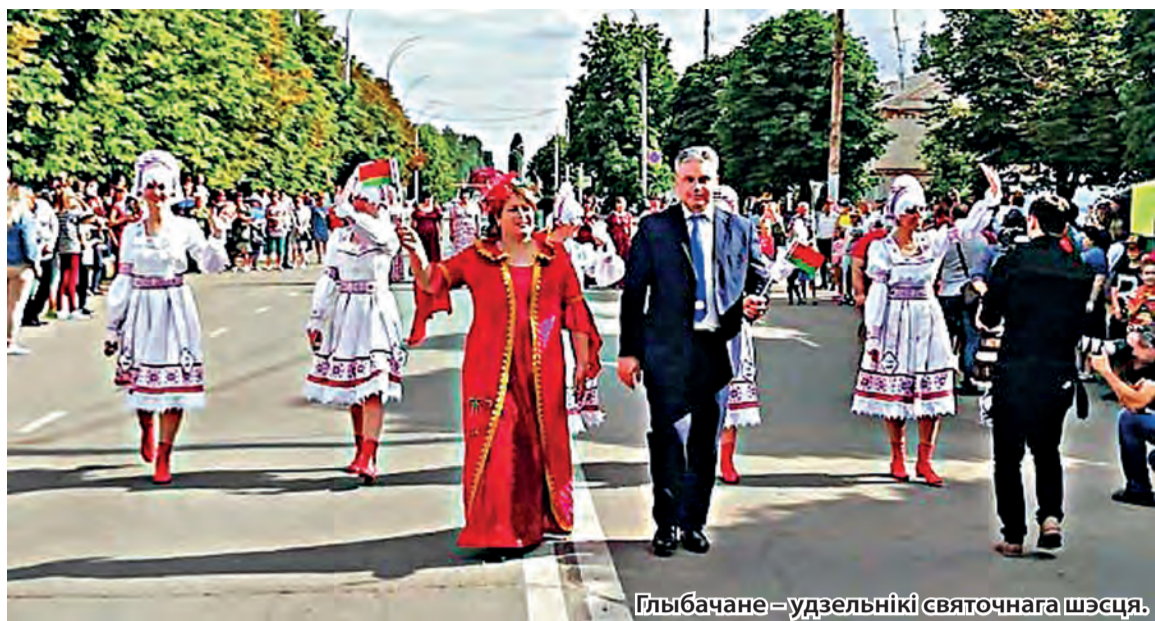
Глыбачане – удзельнікі святочнага шэсця.

—Для выступлення ў той дзень нам была адведзена цэлая гадзі-