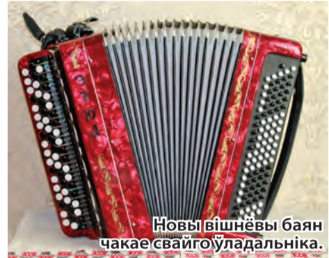
Новы вішнёвы баян чакае свайго ўладальніка.

Конкурсная музычная праграма фэсту гэтага года пачалася з выступлення баяністаў народнага тэатра фальклору «Цярэшка», дыпламантаў II ступені конкурсу «А музыкі граюць, граюць» на «Славянскім базары ў Віцебску». Чарговае свята музыкі стала сапраўды яркім і прайшло на высокім выканаўчым узроўні. Гучалі акардэоны, баяны... Хораша, прыгожа, і ўсё ж слухачам не хапала гармоніка. Так хацелася пачуць звонкія, іскрыстыя, знаёмыя з маленства мелодыі менавіта на двухрадцы. І слухачы пачулі іх. Кіраўнік Заслужанага аматарскага калектыву Рэспублікі Беларусь ансамбля песні і музыкі «Крыніца» Міхаіл Шлег (Дуброўна) так урэзаў «Беларускую польку», што ногі самі пайшлі ў скокі. Станіслаў Румбуціс (Літва) прадоўжыў выступленне «Пецябургскай полькай». І