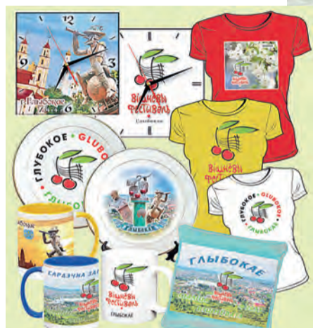
Сувенірная прадукцыя ФОТАцэнтра.

— Ідэя правядзення “Вішнёвага фестывалю” ў Глыбокім цікавая і неардынарная. Яна нам вельмі даспадобы, таму мы стараемся раскруціць гэты брэнд. У нас можна набыць сумкі, чайныя наборы і іншыя тавары з лагатыпам фестывалю. Вялікім попытам у турыстаў і гасцей карыстаюцца кубкі, майкі і бейсболкі. Іх з задавальненнем набываюць і