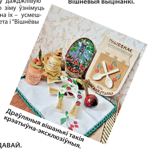
Драўляныя вішанькі такія крэатыўна-эксклюзіўныя.