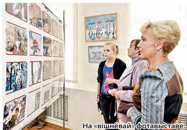
На «вішнёвай» фотавыставе.